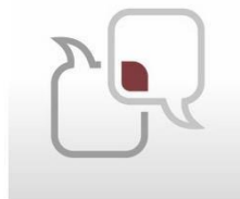
SEMINARE & VORTRÄGE