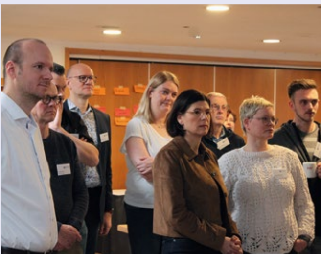
Workshop "KI im Arbeitsalltag"