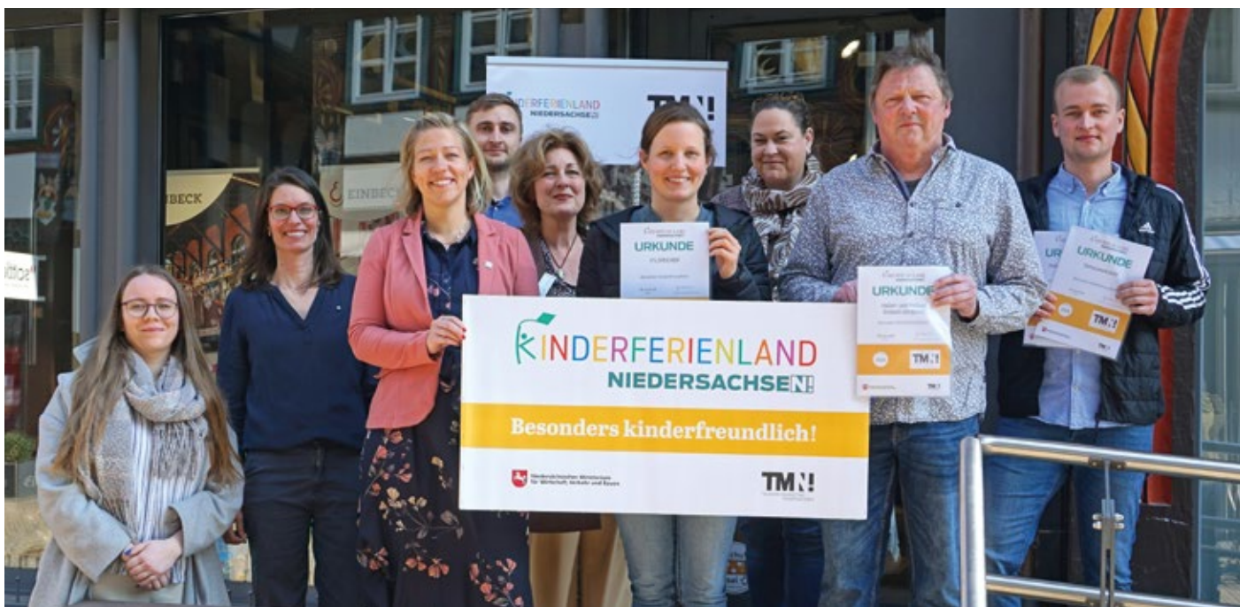
Vertreter der Stadt Einbeck, der Kinderferienland-Betriebe und der TMN präsentieren die Auszeichnung als Kinderferienland-Ort.

Einbeck ist bereits der neunte Kinderferienland-Ort in Niedersachsen. Ebenfalls dazu zählen die Städte Nienburg und Rehburg-Loccum in der Region Mittelweser, das Nordseebad Dangast in Friesland und Butjadingen im Landkreis Wesermarsch, Wolfenbüttel im Braunschweiger Land und Lingen (Ems) sowie die Städte Meppen und Haren im Emsland. Die Qualitätsmarke Kinderferienland Niedersachsen zeichnet Gastgeber und Freizeiteinrichtungen aus, die besonders auf die Bedürfnisse von Familien mit Kindern eingestellt sind und geprüfte Standards erfüllen. ◀