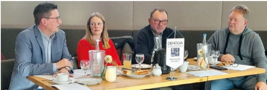
Der Vorstand hatte zur DEHOGA-Versammlung im Heidekreis geladen.

Die Versammlung endete mit einem optimistischen Ausblick auf den Zusammenhalt innerhalb des Verbandes. ◀