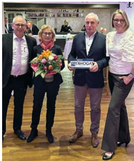
Auch sie fühlten sich auf dem Wirteball bei Hahnenkamp in Werlte sichtlich wohl: Die Mitglieder vom jungen DEHOGA.