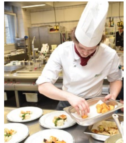
Die Vorbereitungen für das Prüfungssessen laufen.