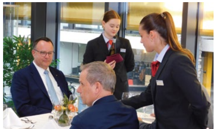
Das Prüfungssessen beginnt.

„Banana Split mal anders“ Mandel-Cannoli, weißes Schokoladen-Bananenmousse, Zartbit- terschokoladen-Ganache, Bananenragout, eingelegte Bananen, Passionsfruchtgel, Mürbeteig-Crumble Vanillecremeeis, Hippengebäck