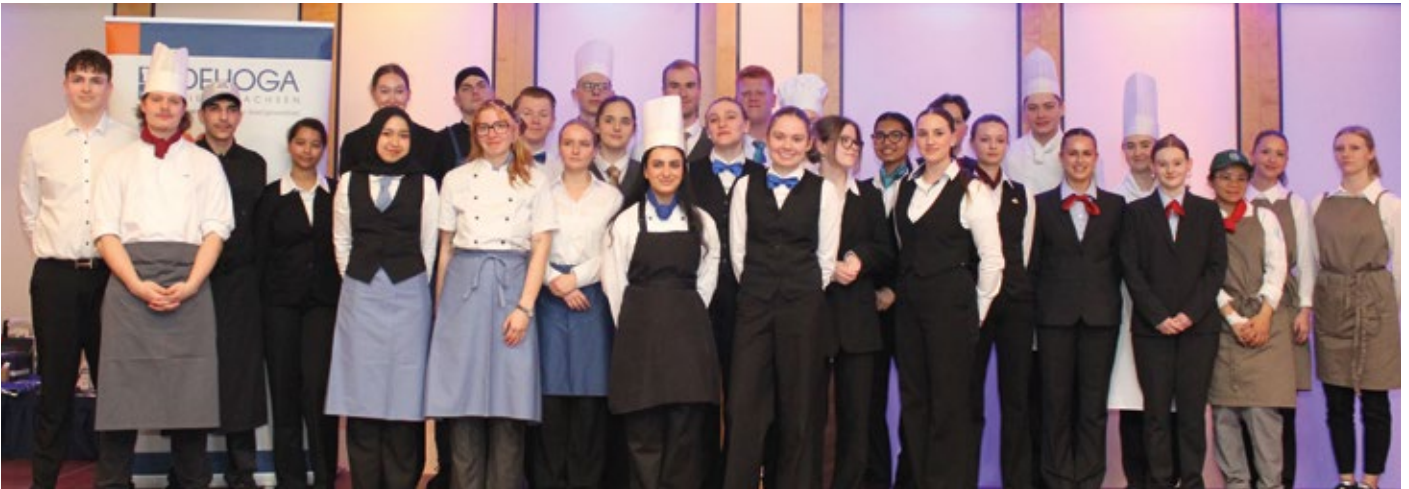
Strahlende Gesichter bei den 30 Teilnehmerinnen und Teilnehmern der Jugendmeisterschaften.

Bildergalerie mit diesen und weiteren Fotos: