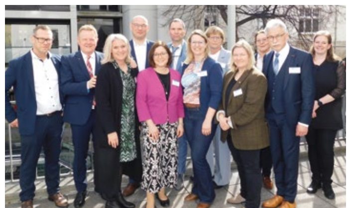
Vielen Dank an die Prüferinnen und Prüfer.