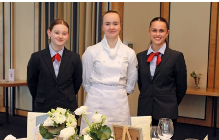
Gold in der Teamwertung für das Team der BBS2 Hannover.